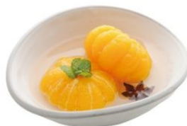
愛媛いよかんの コンポート アニス風