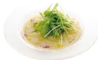
愛媛産 愛鯛のカルパッチョ