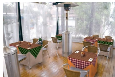
“こたつカフェ”イメージ

本プロジェクトは、表参道の人気カフェ「dining cafe HOME」を旗艦店として、計24店舗のカフェや有名ヘアサロンにて展開します。なかでも、旗艦店である「dining cafe HOME」では、冬の風物詩である「こたつ」と「みかん」をイメージして、テラス席のテーブルを「こたつ」風のアレンジした、新しいカフェスタイル“こたつカフェ”を提案します。お洒落な屋外テラスにいながらも、暖かく、アットホームな雰囲気を体験していただけます。