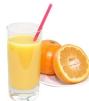
愛媛みかん丸搾り ジュース