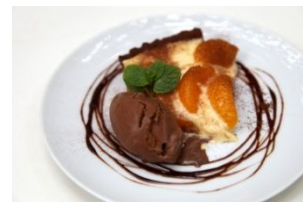
愛媛みかんのタルト チョコレートアイス添え