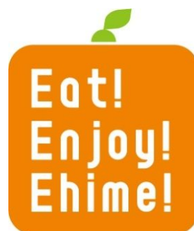
「えひめカフェ」プロジェクトロゴ

今回の『えひめカフェ』プロジェクトは、「Eat Enjoy Ehime」をテーマに情報感度の高い人々が集まる表参道エリアのカフェやヘアサロンにて、愛媛県の農林水産物を使ったオリジナルフードやドリンクを提供します。そして、展開カフェやヘアサロンの情報をまとめたマップや愛媛の柑橘と美容に関する情報を紹介したフリーペーパーを配布する等、表参道エリア一帯で愛媛県の農林水産物の情報を発信します。