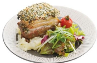
愛媛甘とろ豚の煮込み 香草パン粉焼き ( dining cafe HOME)