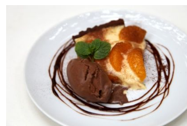
愛媛みかんのタルト チョコレートアイス添え

「dining cafe HOME」では愛媛県の県名にちなんで、「愛(あい)”を“媛(ひめ)”から贈る」バレンタインデー限定のディナーコースを2月6日(月)～2月14日(火)の期間で提供します。コースメニューは、愛媛産の甘とろ豚や愛鯛を使ったイタリアン料理をベースに、みかんを使ったデザートもご用意しています。