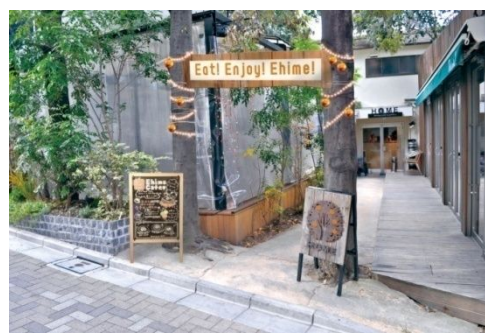
店舗外観イメージ