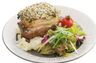
愛媛甘とろ豚の煮込み 香草パン粉焼き