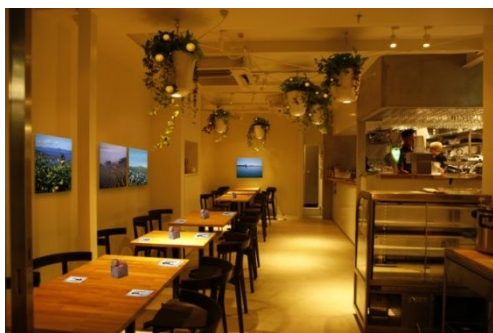
店舗内観イメージ