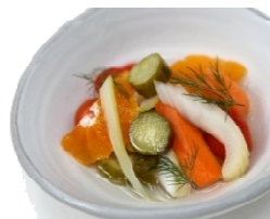
自家製ピクルス 愛媛みかんの香り

コースメニューは2月6日(月)～2月14日(火)の期間、ディナータイムのみでのご提供となります。金額は税込みの予定価格です。