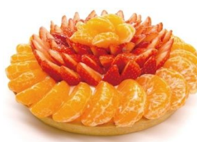
愛媛県産 伊予柑と いちご「あまおとめ」のタルト ( 青山ベリーカフェ)