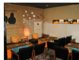
“こたつカフェ”イメージ

今回は人気カフェ「TOKYO APARTMENT CAFE」のテーブルをこたつ風にアレンジした“こたつカフェ”を設置。冬の風物詩である「こたつ」と「みかん」をイメージしており、お洒落なカフェにいながらも、暖かく、アットホームな雰囲気を感じていただけます。