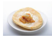
揚げパンハニー 愛媛いよかんマーマレードソースがけ