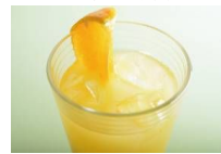
POMジュース ファジーネーブル