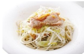
続・媛っこ地鶏のつけだれ