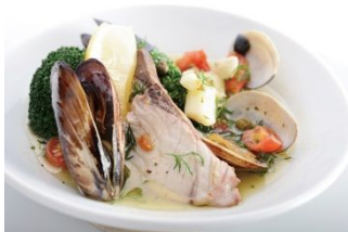
戸島一番ブリのアカパツァ (TOKYO APARTMENT CAFE)