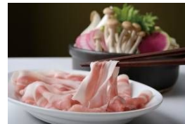
甘とろ豚と愛媛の地野菜の豚すき