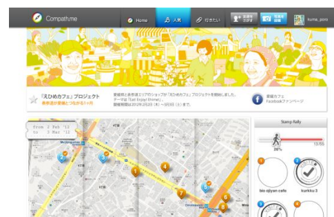
えひめカフェプロジェクト × Compath.me キャンペーンページイメージ

キャンペーン特設ページ: http://www.compath.me/ehime