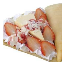
愛媛県産あまおとめの ティラミスクレープ 数量限定 (ストロベリーハウス)