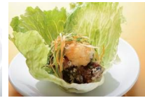
媛っこ地鶏の竜田揚げ