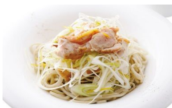
続・媛っこ地鶏のつけだれ (kurkku 3)