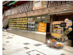
外観装飾イメージ