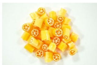
えひめオリジナルキャンディーミックス (Candy Artisans)