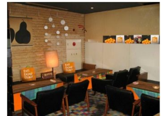
内観装飾イメージ(“こたつカフェ”)