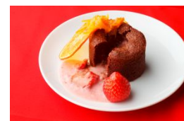
バレンタイン期間限定 愛媛県産あまおとめのフォンダンショコラ (kurkku 3)

「TOKYO APARTMENT CAFE」、「kurkku 3」では、愛媛県の県名にちなんで、「愛(あい)”を“媛(ひめ)”から贈る」をコンセプトに、バレンタイン期間限定のメニューを2月9日(土)～2月15日(金)の期間で提供します。この時期に旬をむかえる、いよかんを使用し、各店の特徴を活かした個性的なスイーツをお楽しみいただけます。