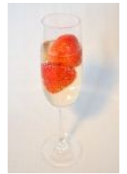
バレンタイン期間限定 ストロベリー&スパークリング