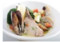
戸島一番プリの アクアパッツァ